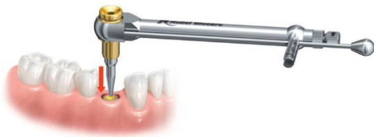
Рисунок В. Установка инструмента для извлечения имплантатов Implant Retrieval Instrument в имплантат

Примечание. Для извлечения имплантатов с внутренним трехканальным соединением в ситуациях, когда повреждено соединение, можно использовать втулку для извлечения имплантата Implant Rescue Collar и держатель Handle, чтобы упростить извлечение имплантата (подробную информацию о держателе Handle к втулке для извлечения имплантата см. в инструкции по применению Nobel Biocare IFU1090) (рисунок С).