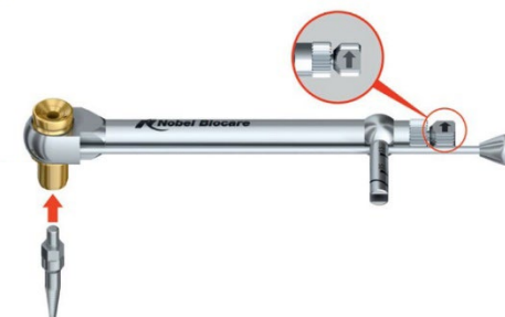
Рисунок А. Установка инструмента для извлечения имплантатов Implant Retrieval Instrument в ручной хирургический динамометрический ключ Manual Torque Wrench Surgical с помощью переходника для ручного динамометрического ключа Manual Torque Wrench Adapter

Внимание! Установите инструмент для извлечения имплантатов Implant Retrieval Instrument в переходник для ручного динамометрического ключа Manual Torque Wrench Adapter и ручной хирургический динамометрический ключ Manual Torque Wrench Surgical.