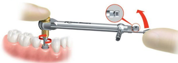
Рисунок D. Выкручивание имплантата путем его вращения против часовой стрелки с помощью ручного хирургического динамометрического ключа Manual Torque Wrench Surgical

5. Выкрутите имплантат, вращая его против часовой стрелки с помощью ручного хирургического динамометрического ключа Manual Torque Wrench Surgical (рисунок D).