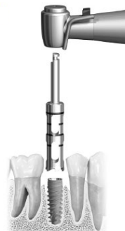
Рисунок F. Установка трепана Trepine Drill поверх имплантата