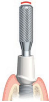
Figura C: Allentamento dell'abutment agitando l'Abutment Release Pin CC

Nota: Nei casi in cui non sia possibile rimuovere l'abutment con Abutment Release Pin CC, si possono utilizzare Abutment Retrieval Instrument Zirconia CC e Abutment Retrieval Instrument Titanium CC per rimuovere, rispettivamente, gli abutment in zirconia (tra cui gli abutment in zirconia con adattatore metallico) e in titanio. Per informazioni relative allo strumento di rimozione dell'abutment, fare riferimento al documento Nobel Biocare IFU1096.