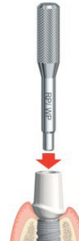
Figura B: Inserimento dell'Abutment Release Pin CC nell'abutment