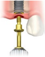
Figure A : Vissage de la vis de couverture

Attention : visser la vis de couverture à la main uniquement pour éviter des charges excessives qui pourraient endommager les pièces de la vis de couverture.