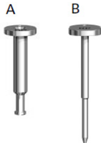
Abbildungen A und B: Hohlzylinder (A) und Entfernungsdorn (B) des zweiteiligen Abutment-Entfernungsinstruments Zirconia CC

Das Abutment-Entfernungsinstrument Zirconia CC wird zum Entfernen von Zirkondioxid-Abutments verwendet. Das Instrument besteht aus zwei Teilen: einem Hohlzylinder („Führungszylinder“, Abbildung A), der durch den Schraubenzugangskanal des Zirkondioxid-Abutments/der prothetischen Versorgung eingeführt wird, und einer zweiten Komponente (Abbildung B), dem „Entfernungsdorn“, der durch den Führungszylinder eingeführt wird. Nach dem Zusammendrücken der beiden Komponenten mit einer Pinzette greift der Führungszylinder in das Abutment ein und hebt es vertikal an, sodass das Abutment von Hand entfernt werden kann.